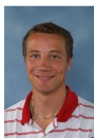
LOOTbegeleider Comenius College

Mail het redactieadres: loot@savorninlohman.nl of geef het door aan je LOOTbegeleider.